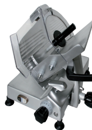
250G RI CE